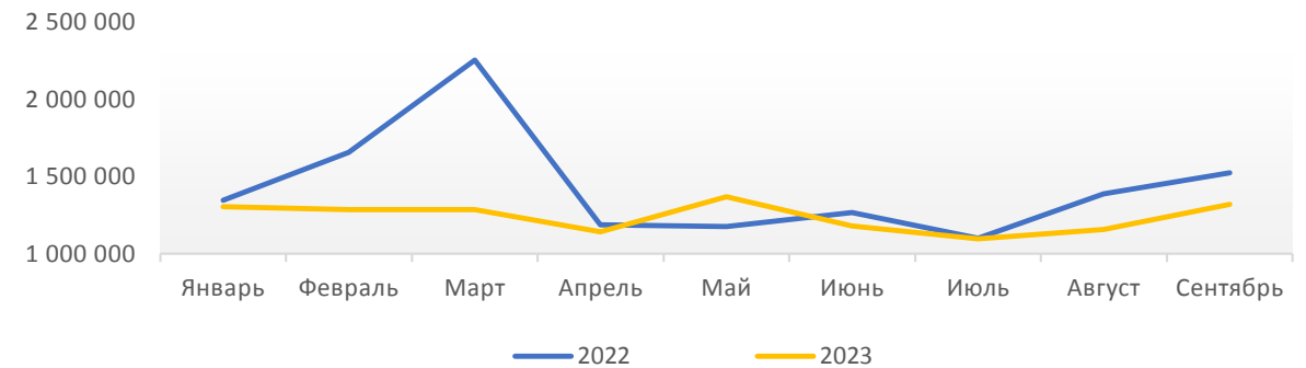
Закупки на одну аптеку в денежном выражении (руб.)

В сентябре 2023 года рост закупок в денежном выражении ускорился (+14,2% к июлю 2023 года, в то время, как июль прирост к июню 2023 всего на 5,4%), разница с результатами 2022 года незначительно сократилась (-13,3% к сентябрю 2022, в августе разница составляла 16,8% год к году).